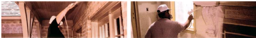
Aplicación de pintura plástica e impermeabilizante