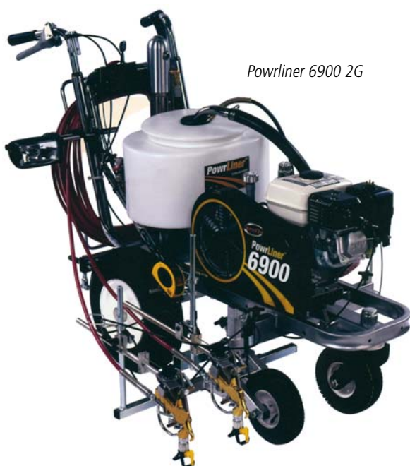
Powliner 6900 2G