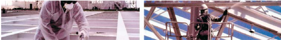
Aplicación de pintura intumescente