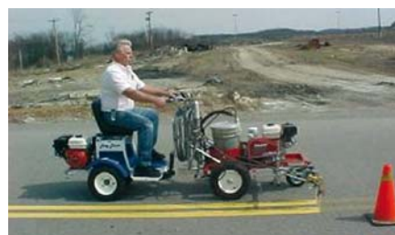
Carro LAZY LINER