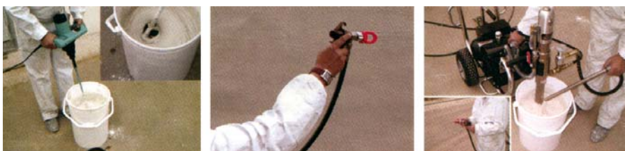
Preparación para aplicación de enlucido proyectable