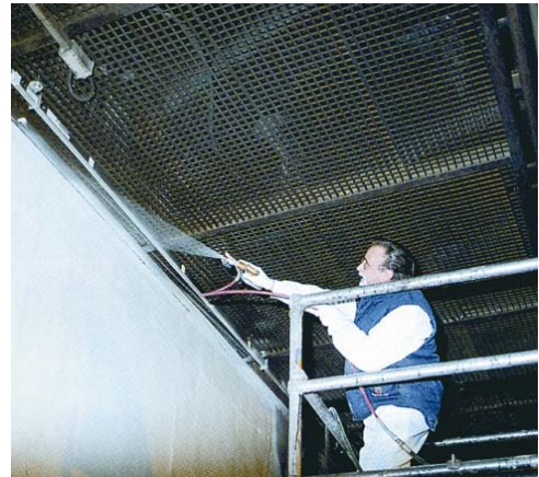
Aplicación de enlucido proyectable